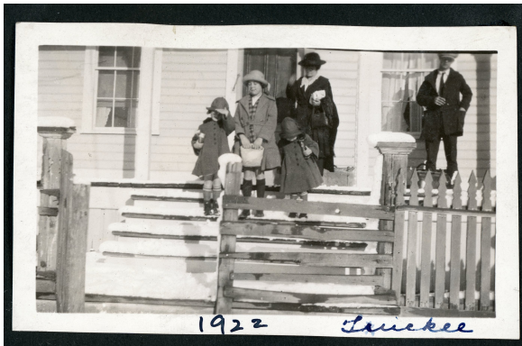
TUC0004 - Possibly Gilmore Family - TUC0006